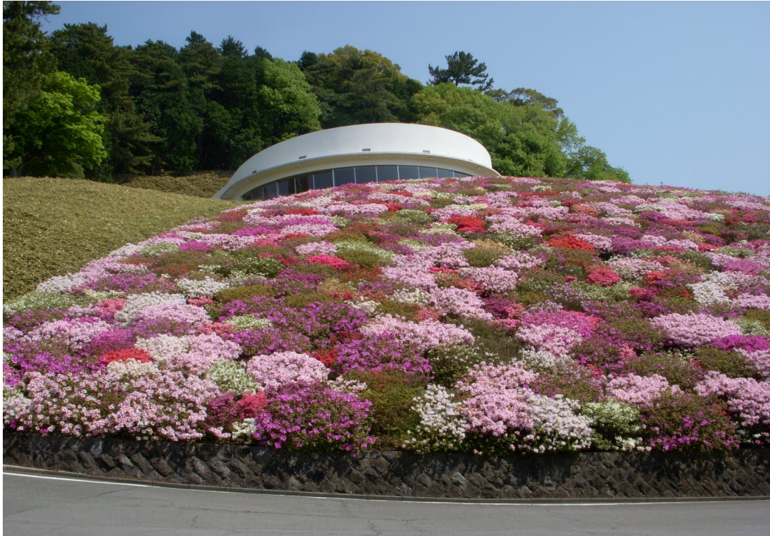
Palácio de Cristal e Colina das Azaléias, no Zuiun-kyo, em Atami

“A partir da pequenina forma do Paraíso, estabelecerei o alicerce da Grandiosa Era de Miroku.”