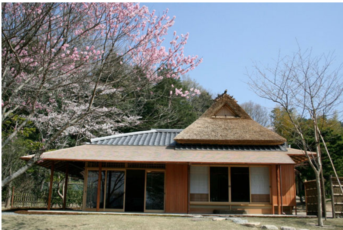
Heyan-kyo, a Terra da Tranqüilidade, o Protótipo do Paraíso em Kyoto

“Concedendo-Me força e sabedoria, o Supremo Criador salva os seres viventes.”