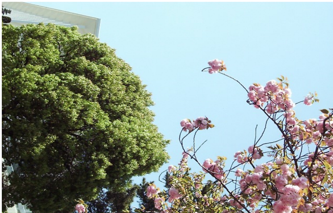
Floração das Cerejeiras, no Zuiun-Kyo de Atami

“A Era dos Deuses será a Era em que a Luz do Messias iluminará ilimitadamente a Terra.”