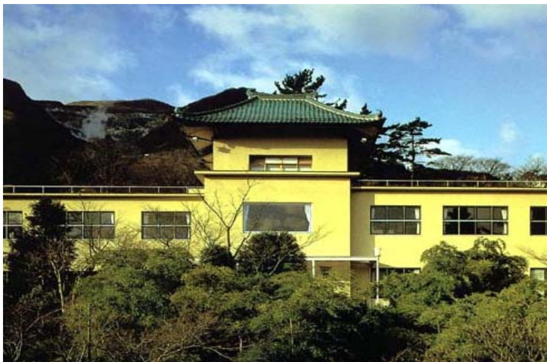
Museu de Belas-Artes de Hakone

“Nesta límpida Terra de Hakone, construirei o Palácio do Belo, para purificar este mundo cheio de impurezas.”