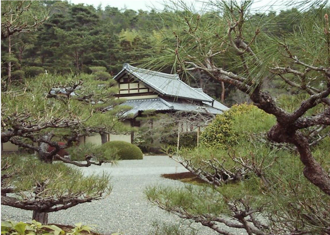
Heian-kyo, a Terra da Tranqüilidade, em Kyoto

“Com a chegada do momento, manifestar-Me-ei como Messias para a salvação de todos os seres viventes.”