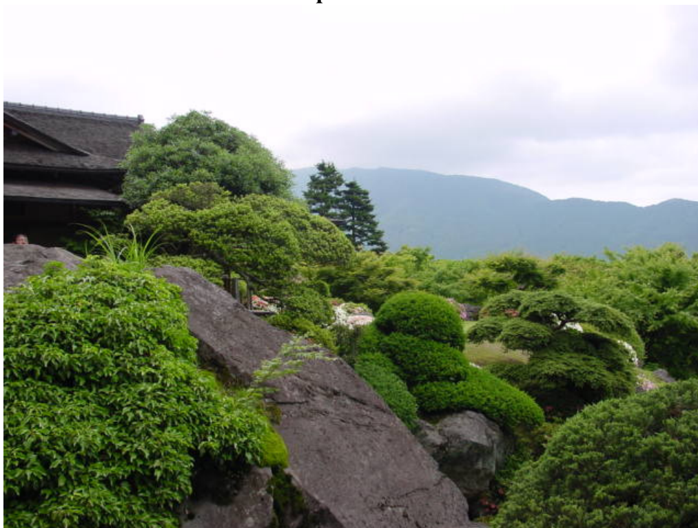
Shinsenkyo, o Protótipo Primordial de Hakone

“Homens! Vinde a mim! Abram os olhos, que o Paraíso se aproxima.”