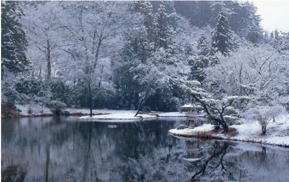
Heian-kyo, o Protótipo de Kyoto, durante o inverno

“Estabelecerei o paradisíaco Reino dos Céus, tão ansiosamente esperado, neste Mundo Material.”