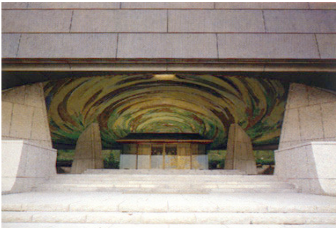
Koomyo Shinden, Santuário da Luz Divina, em Hakone

“Vivo para cumprir uma grande missão. Devo empenhar-me, com todas as minhas forças, na salvação do mundo.”