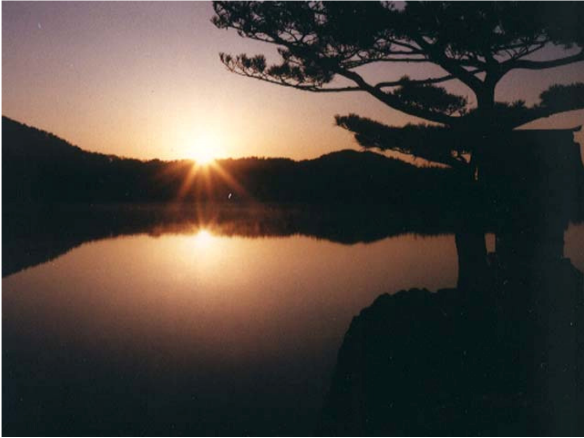
Pôr-do-Sol no Lago Hirosawa, no Heian-Kyo, a Terra da Tranqüilidade, Kyoto

“Estou construindo o Protótipo do Paraíso para que as pessoas exaustas deste mundo nele possam descansar.”