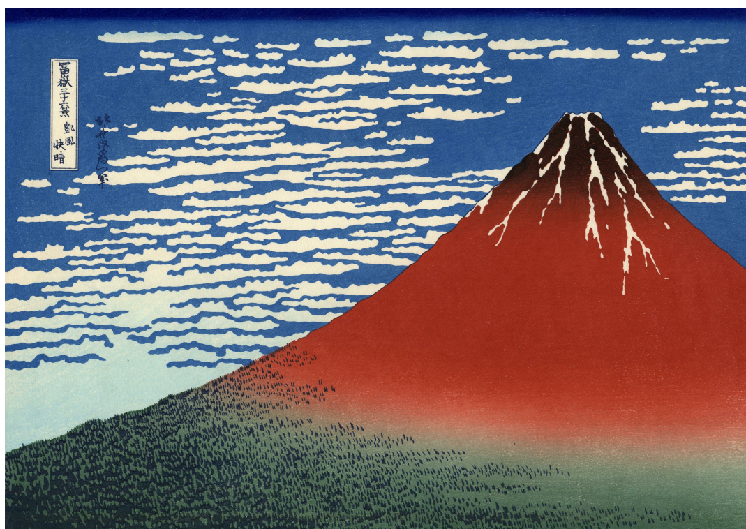
O Monte Fuji com Tempo Limpo (também conhecida por Fuji Vermelho), de Katsuhika Hokusai, Museu de Belas-Artes MOA, Atami

“Vivo com um grande ideal. Todavia, estou também atento às pequenas coisas.”