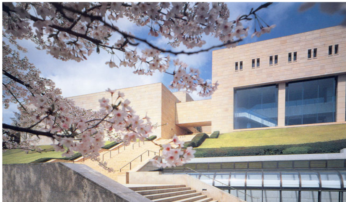
Museu de Belas-Artes MOA, no Zuiun-kyo de Atami

“Serei Eu a salvar este conturbado Mundo Material, manifestando a Força de União com Deus.”