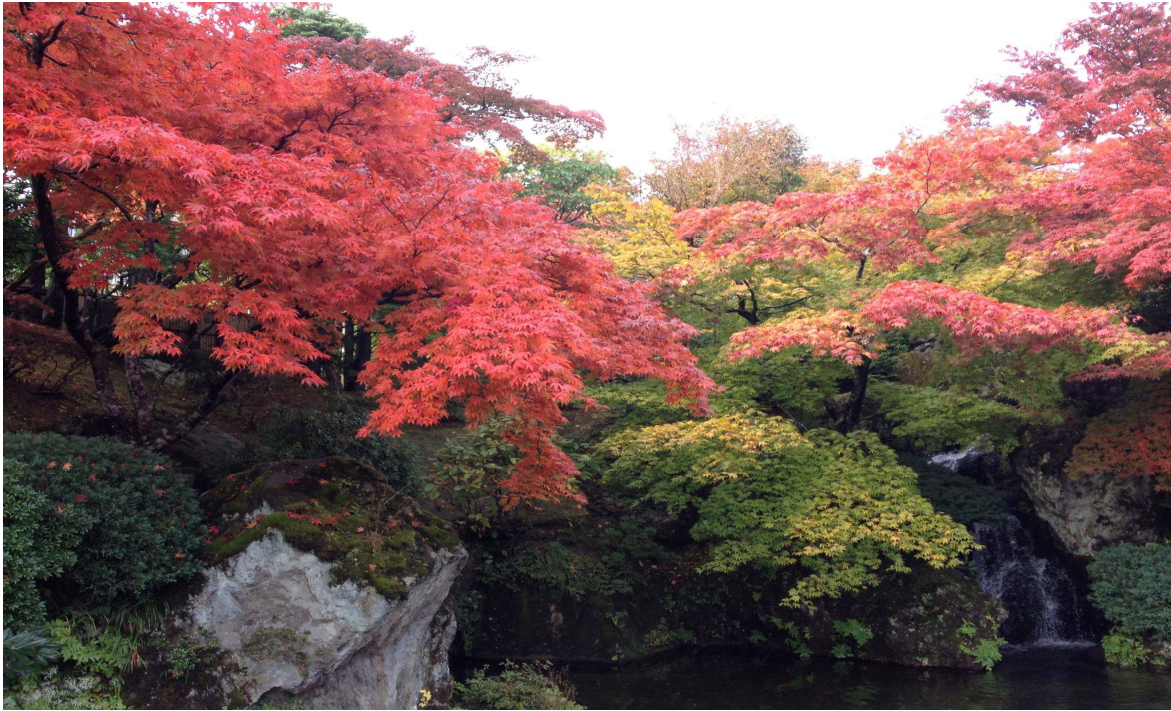
Jardins do Shinsen-kyo, o Protótipo do Paraíso Terrestre de Hakone

"A Arte Médica criada por mim, Deus único, será a base da Era Divina" (5 de janeiro de 1944) (marcador de livro)