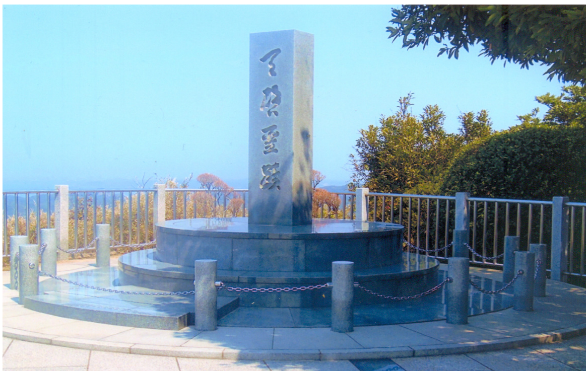
Monumento no Monte Nokogiri que marca a Revelação da Transição da Noite para o Dia

“Construí o Jardim da Arte que lava as impurezas que maculam a mente humana” (15 de junho de 1953)