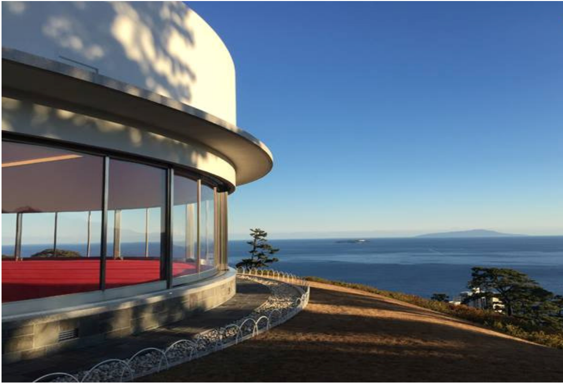
Palácio de Cristal, no Zuiun-kyo, em Atami

“Desde os tempos remotos, só existe um Ensino iniciado com a Arte: o do Messias” (20 de maio de 1953)