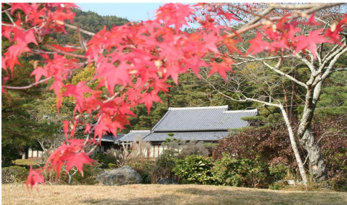
Heian-kyo, a Terra da Tranqüilidade, em Kyoto

“O Paraíso é o Mundo da Beleza, homens e mulheres humildes também têm a natureza por amiga” (22 de julho de 1953)