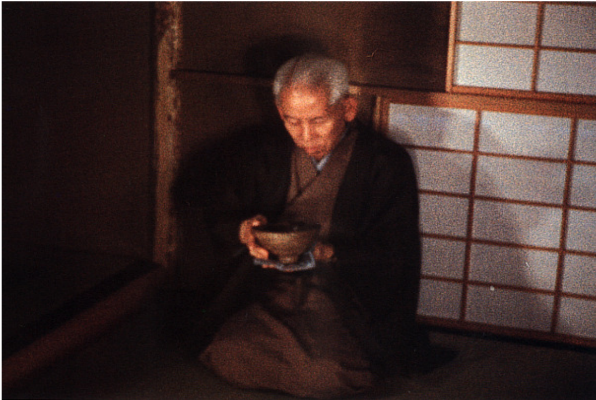
Meishu-Sama tomando chá

“Tendo ao fundo a vista do mar e as montanhas, construí o Paraíso do Belo sobre a colina de Atami” (23 de dezembro de 1953)