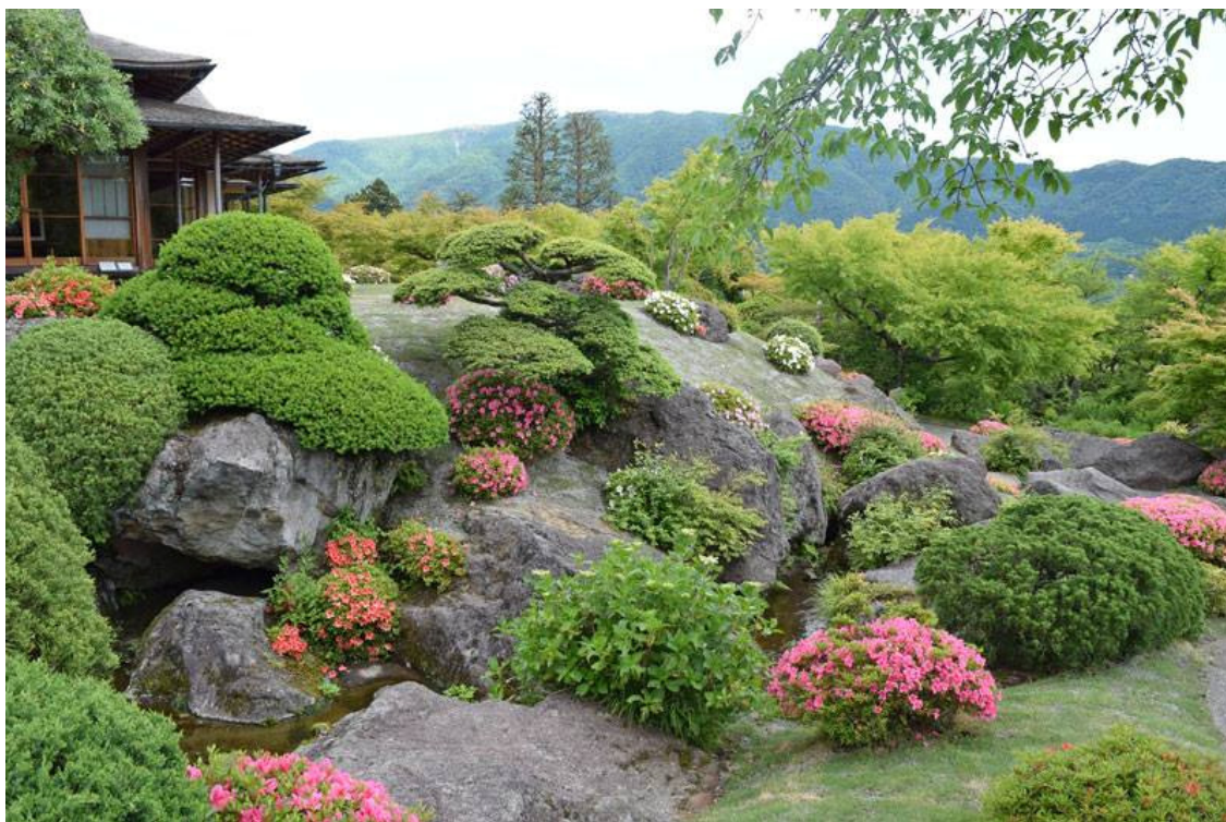
Jardins do Shinsen-kyo, o Protótipo do Paraíso Terrestre em Hakone

“Estou a construir o palácio da beleza sem igual no mundo inteiro” (27 de abril de 1952)