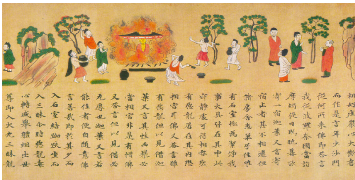
Fragmento Ilustrado do Sutra sobre a Causalidade do Passado e Presente, obra de arte do Museu MOA, em Atami

(25 de outubro de 1951) (Marcador de livro)