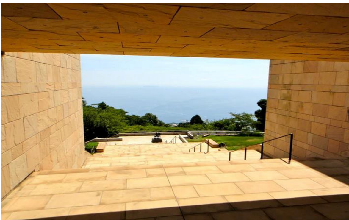
Entrada do Museu MOA, no Zuiun-kyo, em Atami