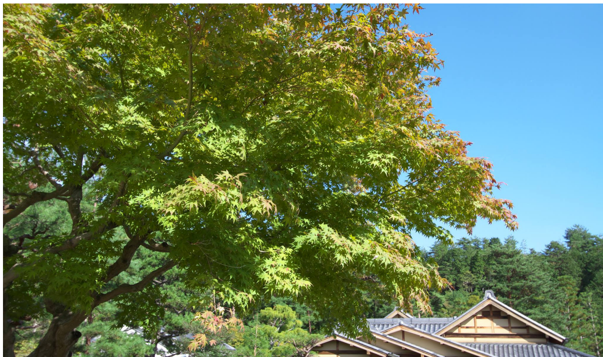
Heian-kyo, o Protótipo do Paraíso Terrestre de Kyoto

“Comovido estou com a mão de Deus da Arte, ao contemplar o monte Takao tingido de vermelho de folhas outonais” (25 de novembro de 1927)