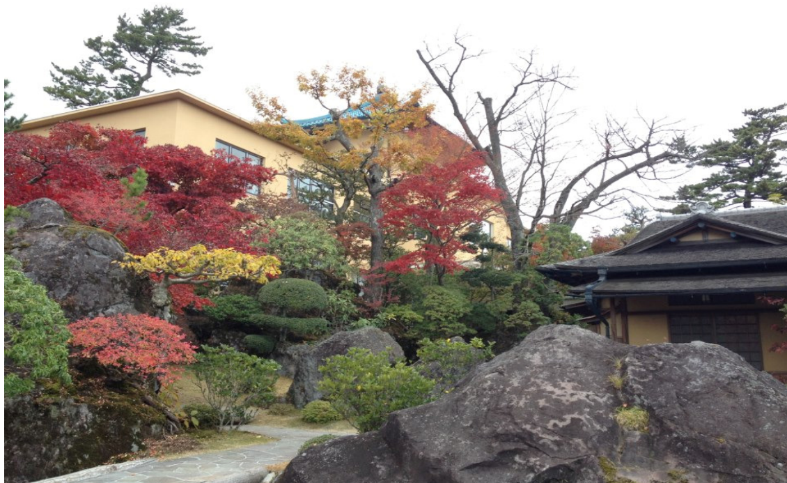
Museu de Arte de Hakone durante o outono

"Sinto-me feliz ao ver aumentar dia-a-dia as pessoas que vêm admirar o Palácio da Beleza, o jardim da raridade" (25 de agosto de 1953)