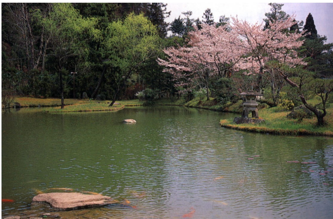
Heyan-kyo, a Terra da Tranqüilidade, o Protótipo do Paraíso em Kyoto

“Reunindo todas as belezas existentes no mundo, retratarei o aspecto do Paraíso ()” (23 a 27 de março de 1952)