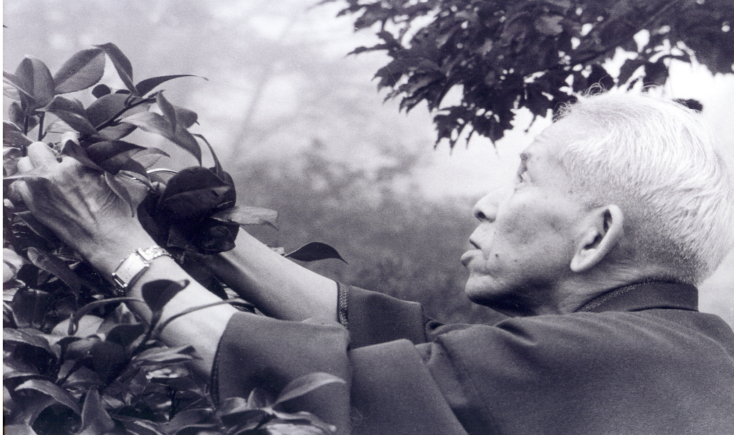
Meishu-Sama colhendo flores no jardim

“O mundo inteiro arregalará os olhos: o nobilíssimo Paraíso da Beleza nasceu em Atami” (23 de dezembro de 1953)