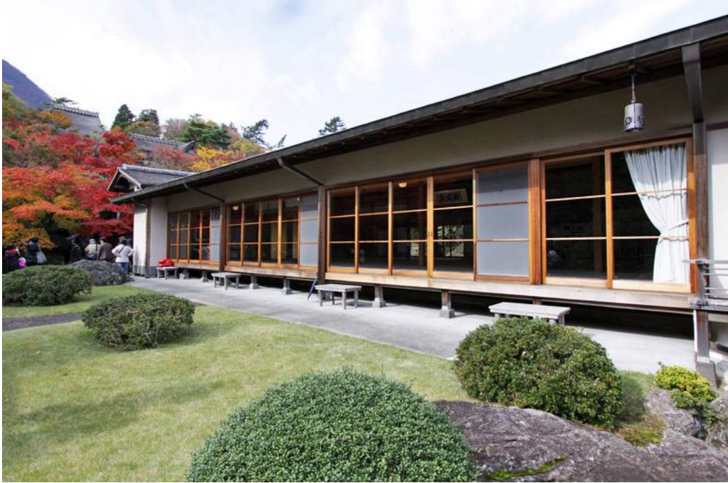
Nikko-Den, o Palácio da Luz do Sol, no Shinsen-kyo, o Protótipo do Paraíso Terrestre de Hakone

“A Era Divina de beleza e paz será construída neste solo puro e justo” (1936)