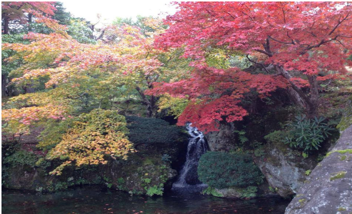
Jardins do Shinsen-kyo, o Protótipo do Paraíso Terrestre em Hakone