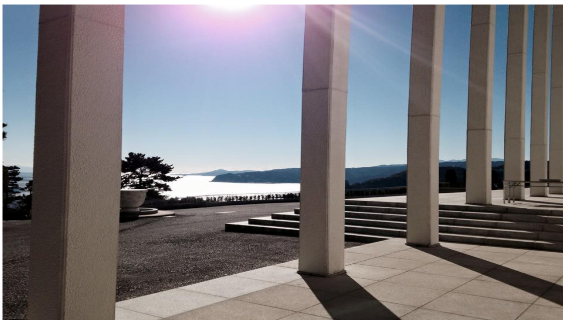
Templo Messiânico no Zuiun-kyo, o Protótipo do Paraíso Terrestre em Atami

“Visando construir a Era plena de Verdade, Bem e Beleza não paro de refletir dia e noite” (25 de fevereiro de 1952)