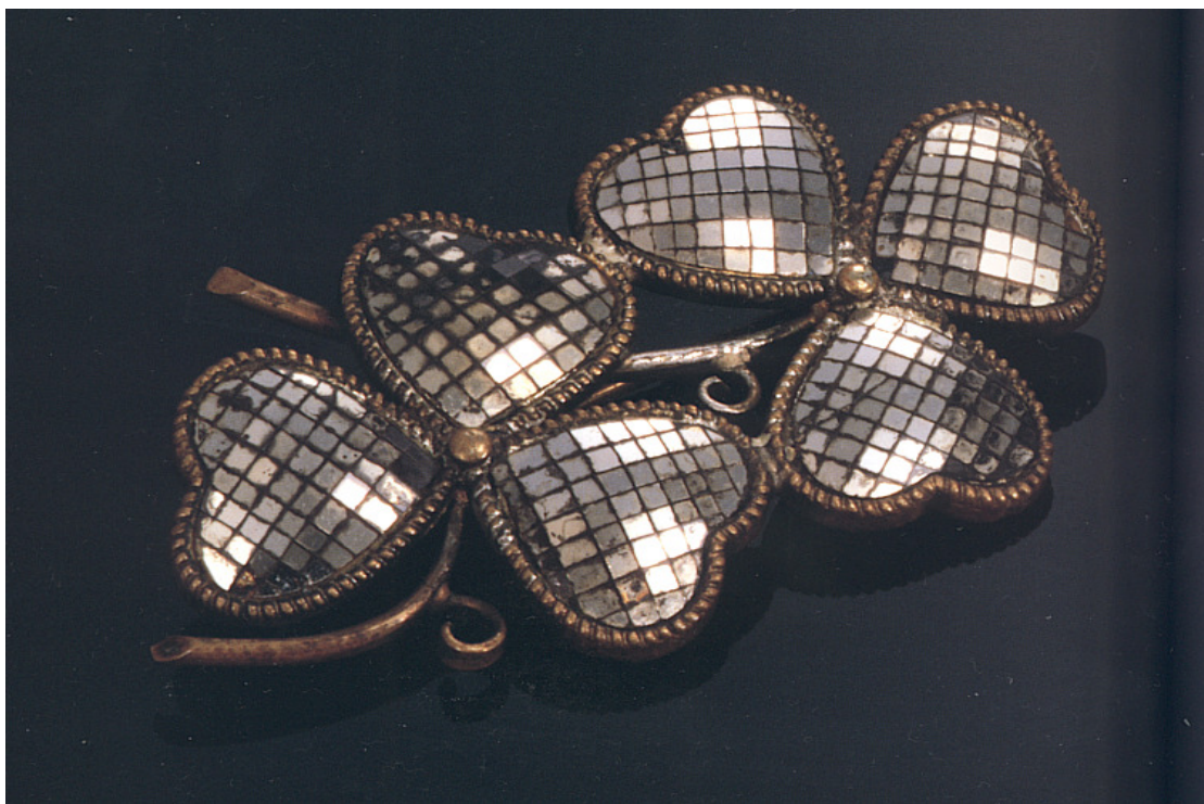
Diamante Asahi, criação de Meishu-Sama

“Transformar a arte do inferno de hoje em arte do Paraíso, é o que desejo” (25 de outubro de 1951)