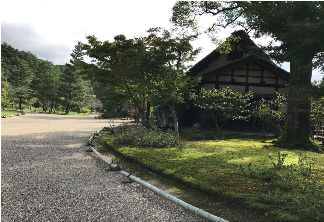
Heyan-kyo, a Terra da Tranqüilidade, o Protótipo do Paraíso em Kyoto

“Farei resplandecer toda a beleza natural e artificial neste Paraíso Terrestre” (23 a 27 de março de 1952)