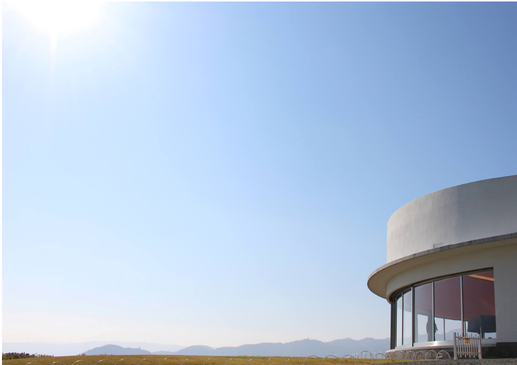
Palácio de Cristal, no Zuiun-kyo, o Protótipo do Paraíso Terrestre em Atami

“Aquele que aprecia a Arte será o povo do mundo paradisíaco que virá em breve” (20 de maio de 1953)