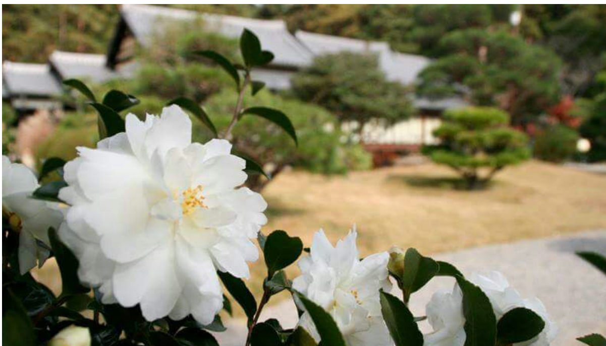
Heian-kyo, a Terra da Tranqüilidade, em Kyoto

“Se não se interessa pela Arte é o sinal de que ainda não foi salvo” (22 de julho de 1953)