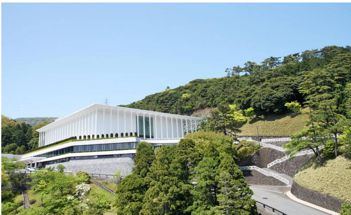
Templo Messiânico e Escadaria Relâmpago no Zuiun-kyo, o Protótipo do Paraíso Terrestre em Atami

“Esteja acima de tudo, de estilos e tendências: Creio que é assim que nasce a grande arte” (1º de setembro de 1931)