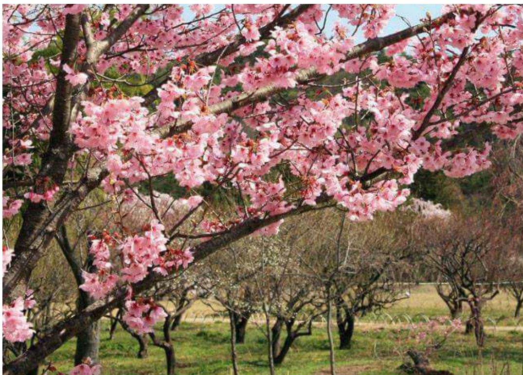
Heian-kyo, o Protótipo do Paraíso Terrestre de Kyoto

“No Jardim Divino que reflete o Paraíso o belo Palácio dá um toque de elegância”