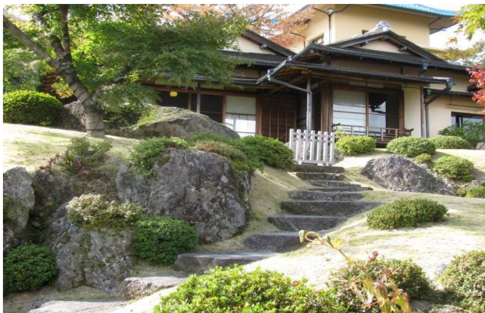
Kanzan-tei, o Solar de Contemplação da Montanha, no Shinsen-kyo, o Protótipo do Paraíso Terrestre em Hakone

“Ao mesmo tempo em que se aproveita toda a beleza natural, adiciona-se-lhe a beleza artificial no Jardim Divino” (27 de abril de 1952)