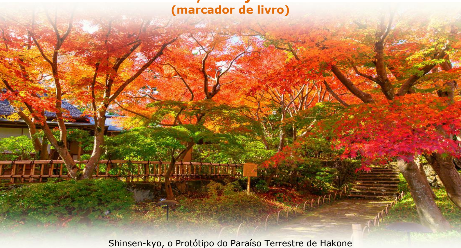
Shinsen-kyo, o Protótipo do Paraíso Terrestre de Hakone

Meishu-Sama, 5 de janeiro de 1944 (marcador de livro)