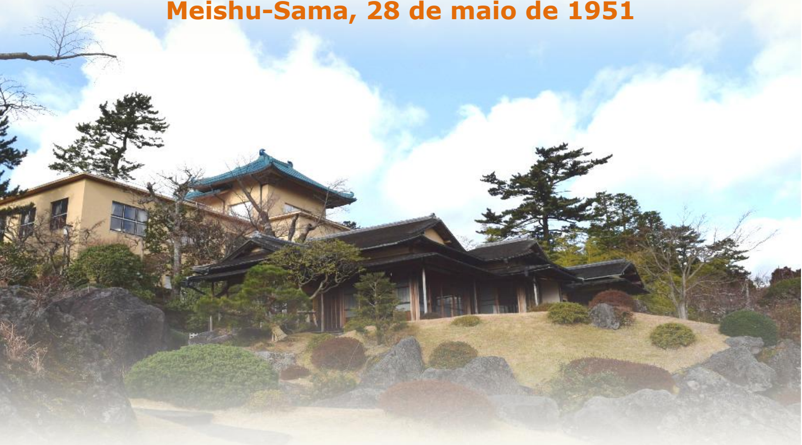
Shinen-Kyo, a Terra do Mistério Divino, o Protótipo do Paraíso Terrestre de Hakone