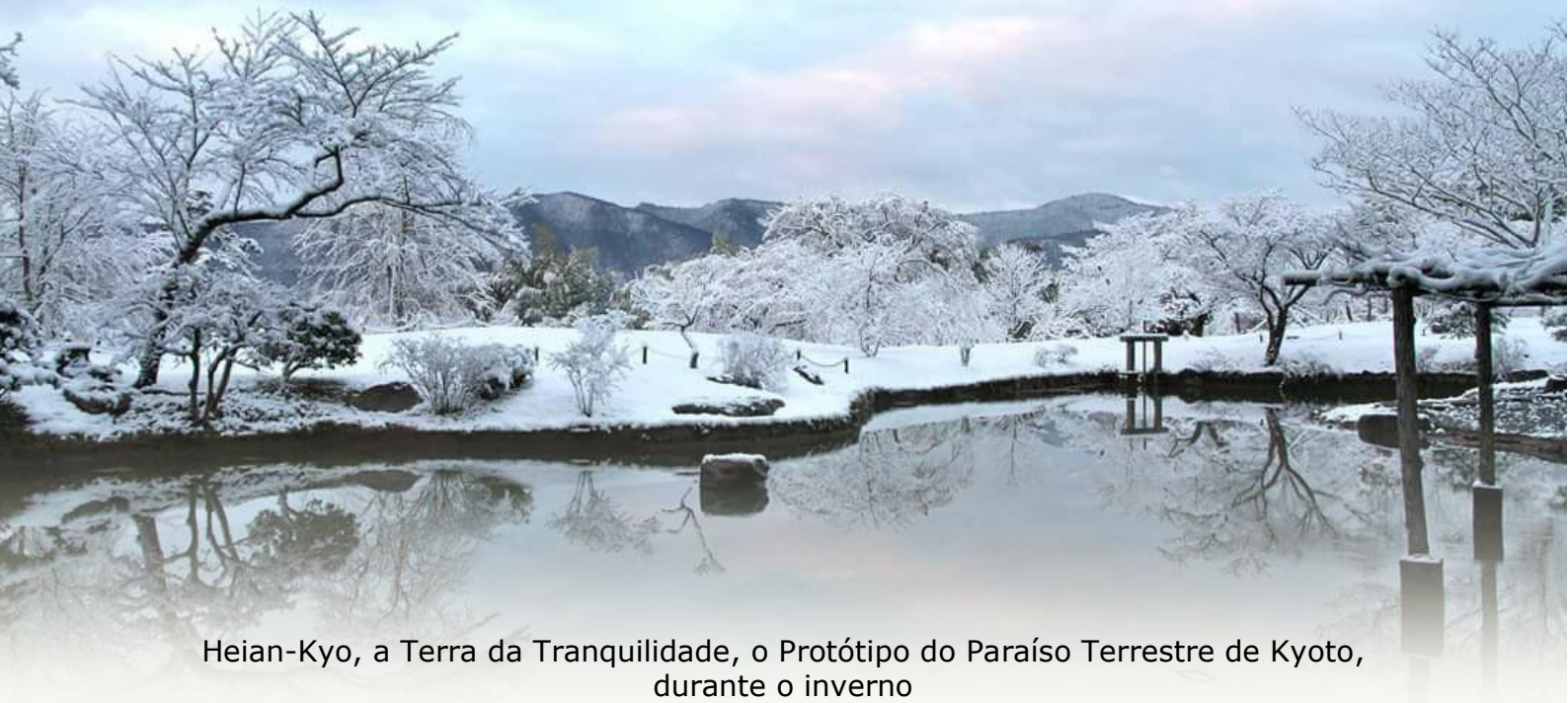
Heian-Kyo, a Terra da Tranquilidade, o Protótipo do Paraíso Terrestre de Kyoto, durante o inverno

“Mundo pleno de Verdade, Bem e Belo, eis o Paraíso Terrestre que tanto almejo” Meishu-Sama, 23 de março de 1947 (marcador de livro)