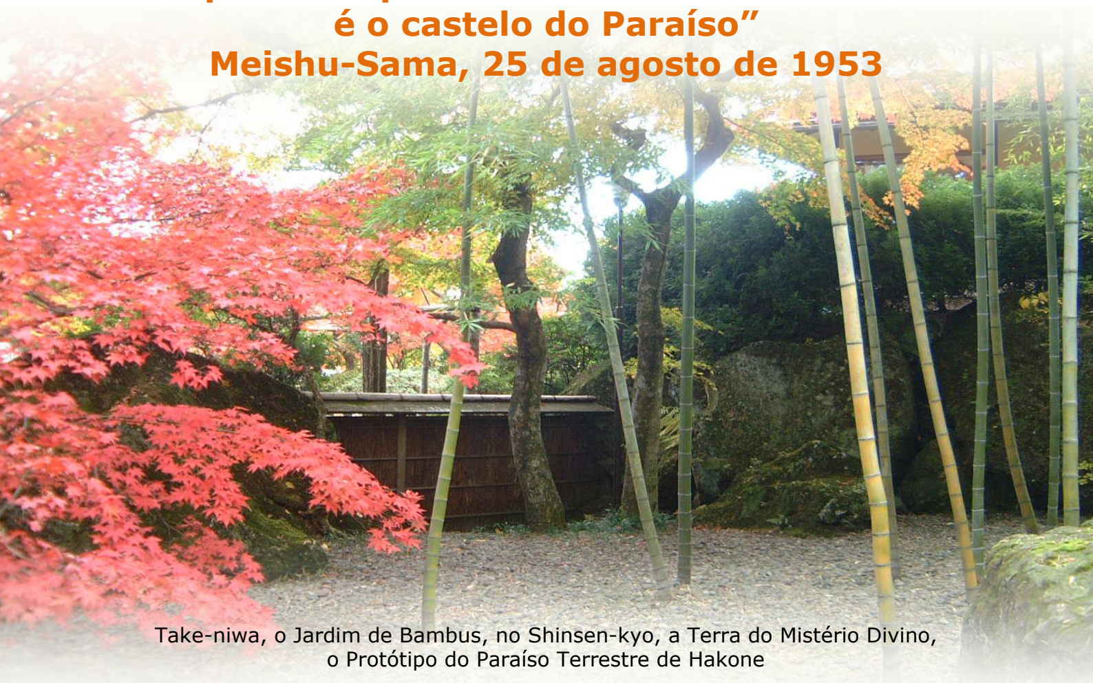
Take-niwa, o Jardim de Bambus, no Shinsen-kyo, a Terra do Mistério Divino, o Protótipo do Paraíso Terrestre de Hakone