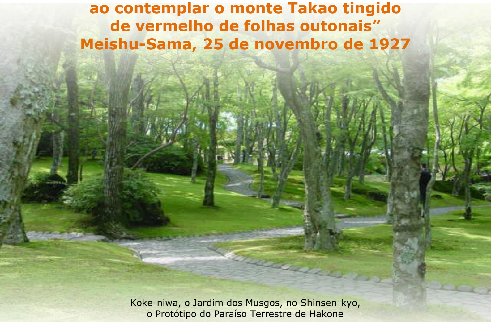
Koke-niwa, o Jardim dos Musgos, no Shinsen-kyo, o Protótipo do Paraíso Terrestre de Hakone