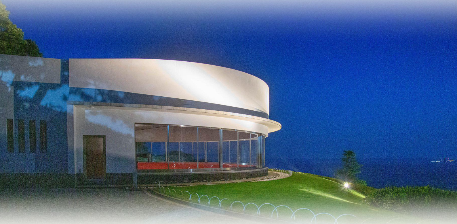
Suisho-Den, o Palácio de Crista, no Zuiun-kyo, a Terra das Nuvens Alvissareiras, o Protótipo do Paraíso Terrestre de Atami