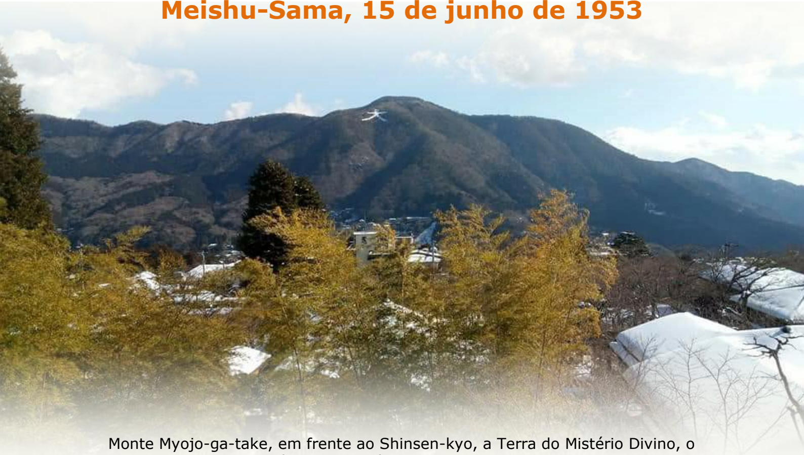
Monte Myojo-ga-take, em frente ao Shinsen-kyo, a Terra do Mistério Divino, o Protótipo do Paraíso Terrestre de Hakone

“Construindo sobre a montanha de Hakone o belo Jardim da Arte, alegre a humanidade” Meishu-Sama, 15 de junho de 1953