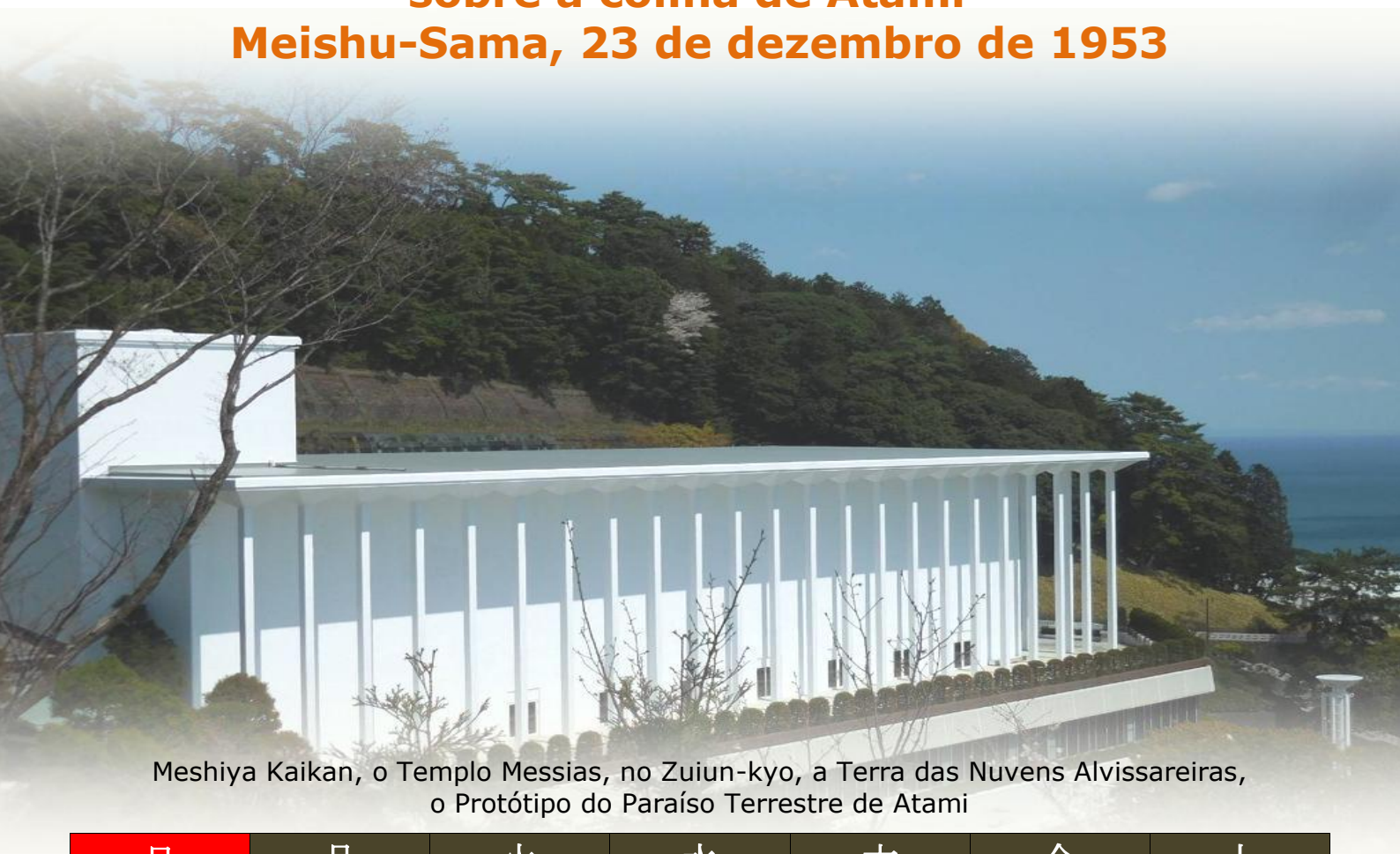
Meshiya Kaikan, o Templo Messias, no Zuiun-kyo, a Terra das Nuvens Alvíssareiras, o Protótipo do Paraíso Terrestre de Atami