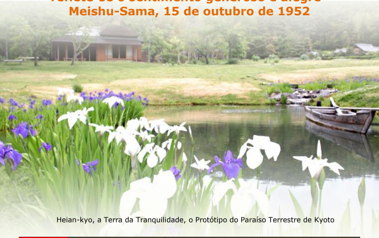
Heian-kyo, a Terra da Tranquilidade, o Protótipo do Paraíso Terrestre de Kyoto

“No quadro pintado com alegria abençoado seja, reflete-se o sentimento generoso e alegre” Meishu-Sama, 15 de outubro de 1952