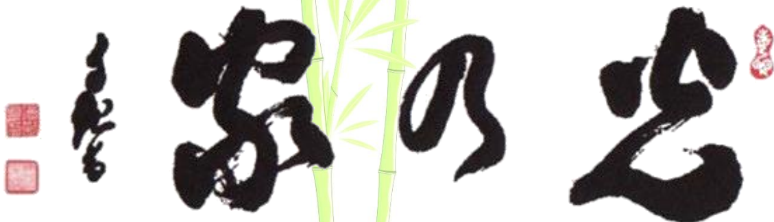
Caligrafia de Meishu-Sama Hikari-no-Ie Lar iluminado