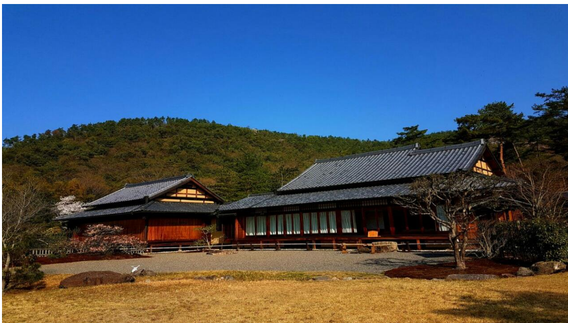
Shunju-An, a Vila Primavera-Outono, no Heian-kyo, o Protótipo do Paraíso Terrestre de Kyoto

“Nos dias de chuva mansa, tenho a impressão de estar vendo uma pintura a nanquim da paisagem” (25 de agosto de 1953)