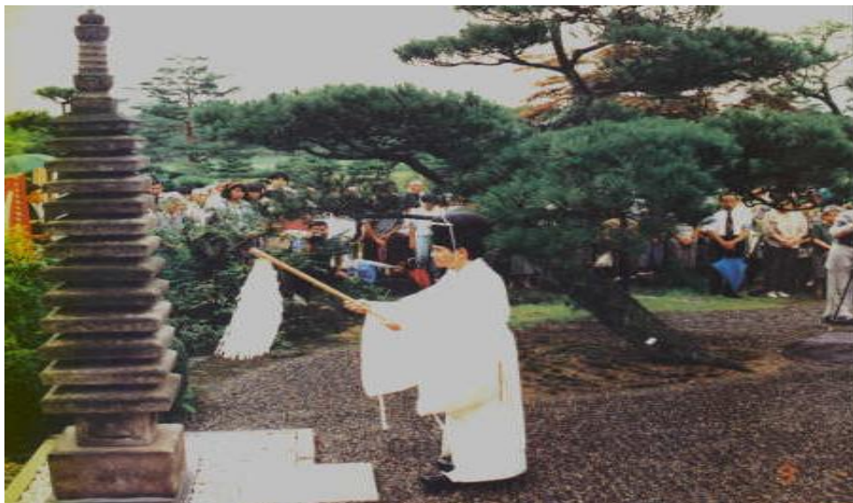
Cerimônia Provisória de Assentamento da Torre de Miroku